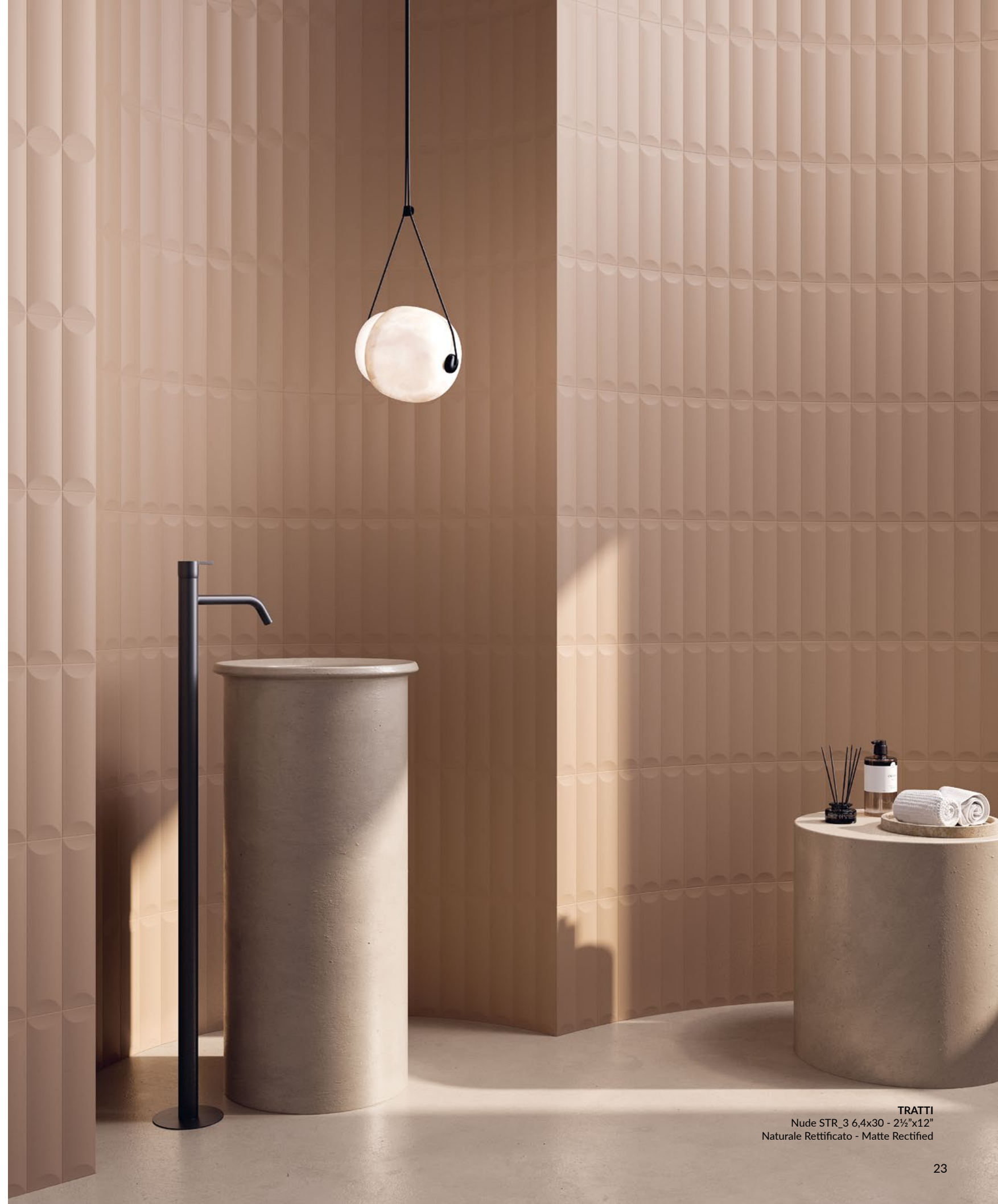
TRATTI Nude STR_3 6,4x30 - 2¼"x12" Naturale Rettificato - Matte Rectified