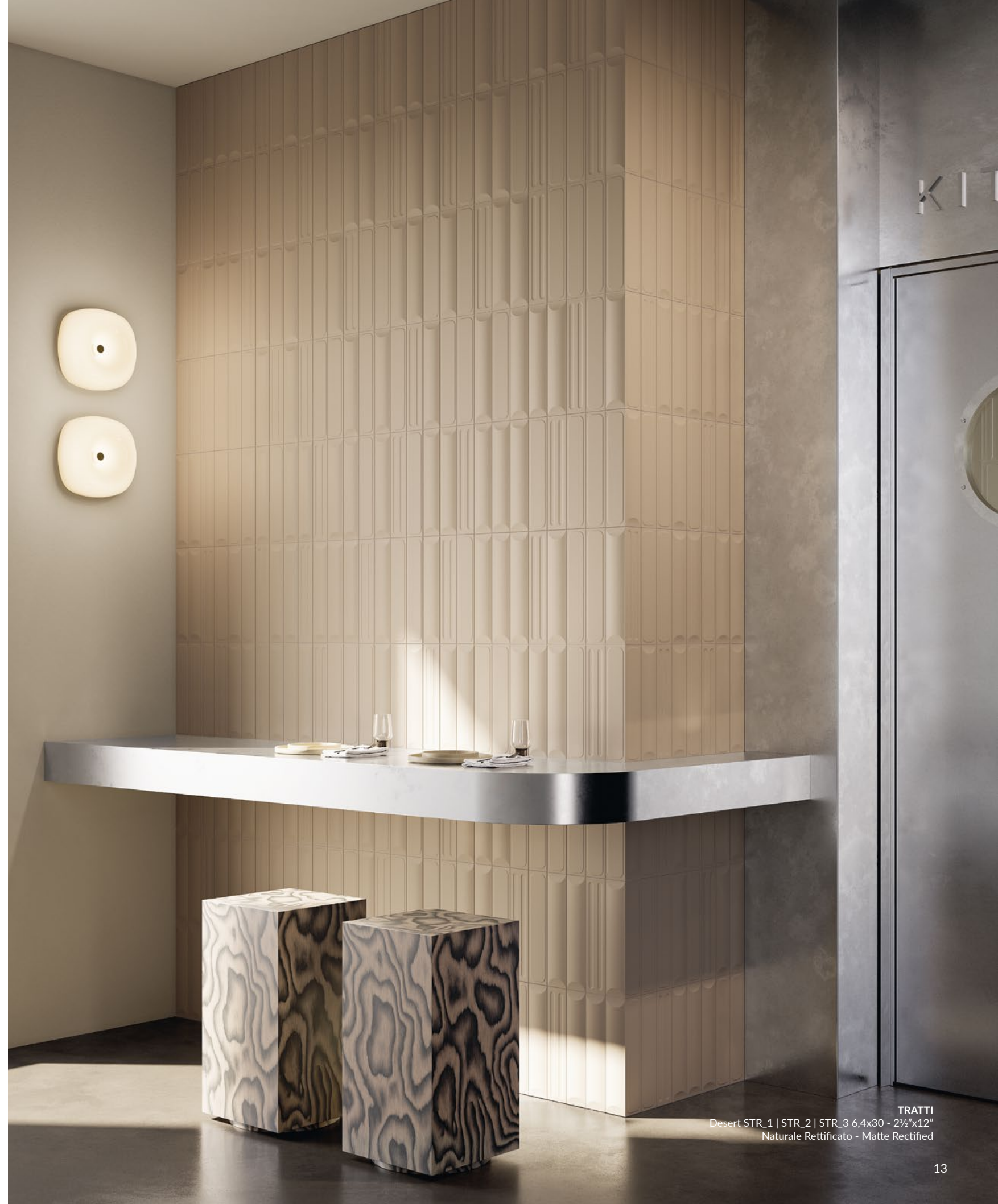
TRATTI Desert STR_1 | STR_2 | STR_3 6,4x30 - 2½"x12" Naturale Rettificato - Matte Rectified