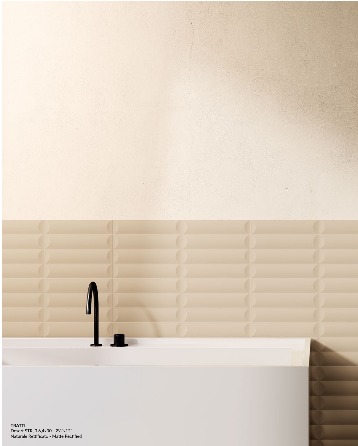
TRATTI Desert STR_3 6,4x30 - 2½"x12" Naturale Rettificato - Matte Rectified