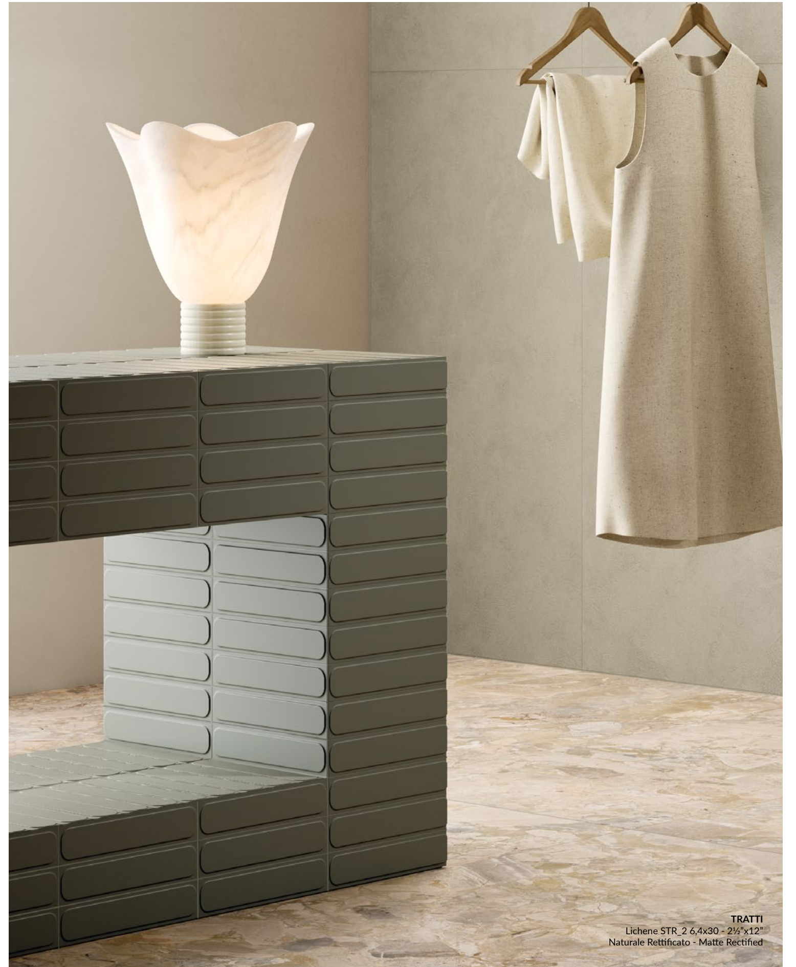
TRATTI Lichene STR_2 6,4x30 - 2½"x12" Naturale Rettificato - Matte Rectified