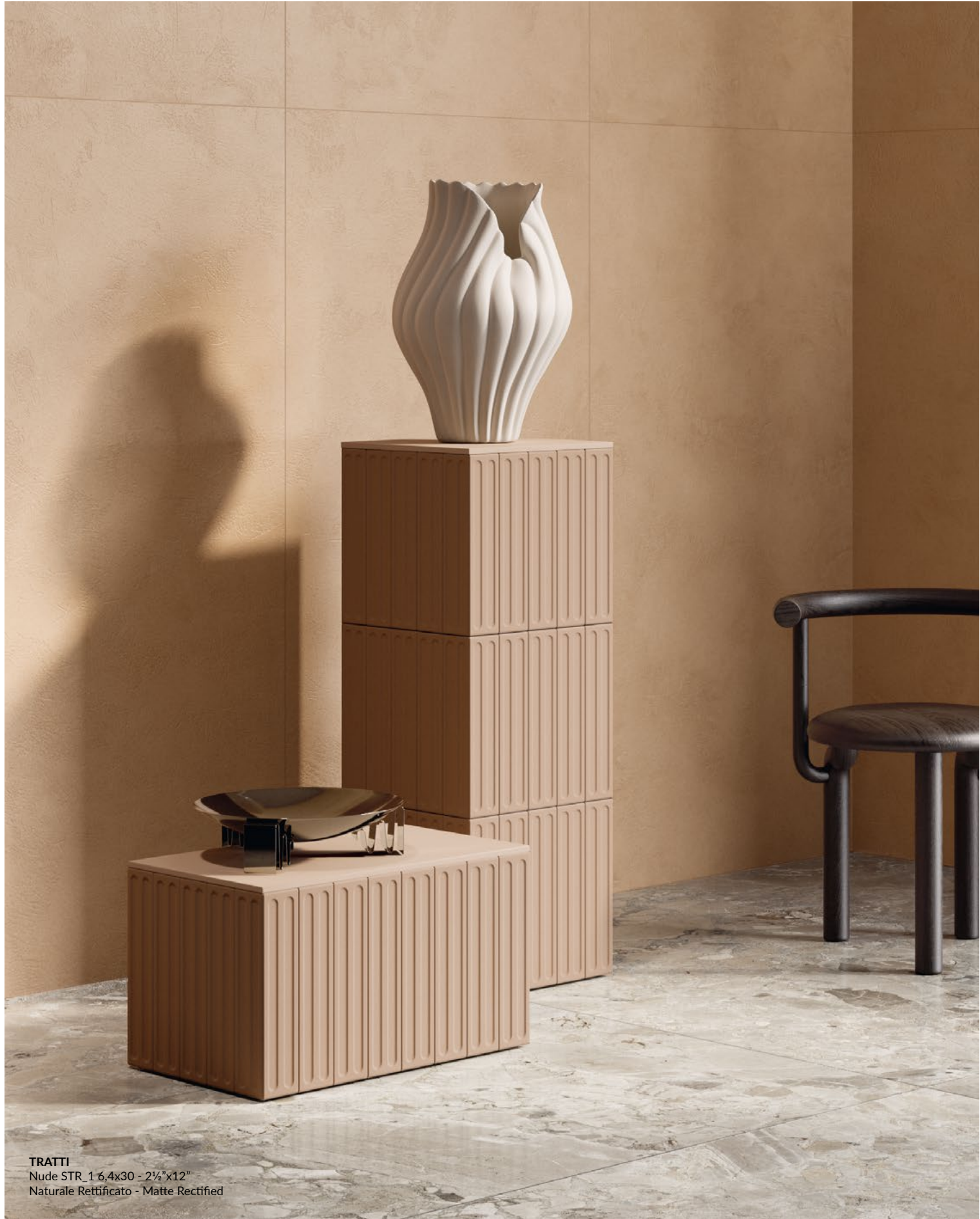
TRATTI Nude STR_1 6,4x30 - 2¼"x12" Naturale Rettificato - Matte Rectified