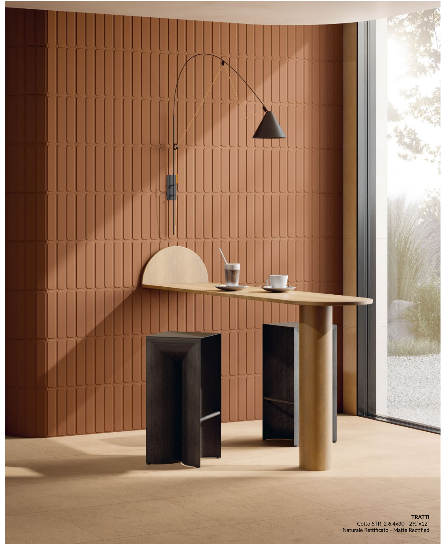
TRATTI Cotto STR_2 6,4x30 - 2½"x12" Naturale Rettificato - Matte Rectified