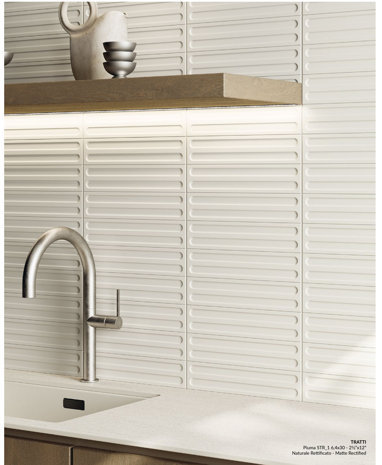
TRATTI Piuma STR_1 6,4x30 - 2½"x12" Naturale Rettificato - Matte Rectified