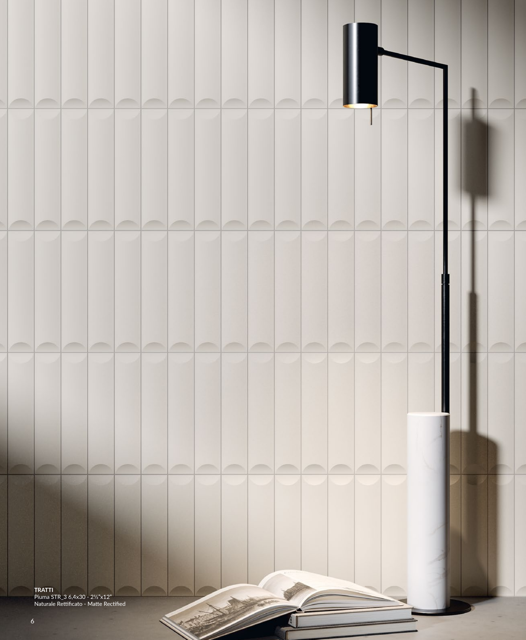
TRATTI Piuma STR_3 6,4x30 - 2½"x12" Naturale Rettificato - Matte Rectified