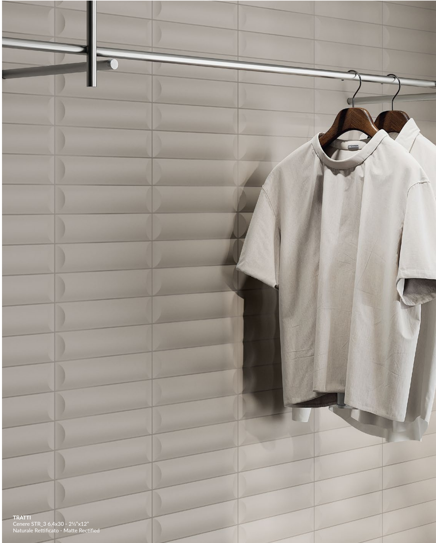
TRATTI Cenere STR_3 6,4x30 - 2 1/4"x12" Naturale Rettificato - Matte Rectified