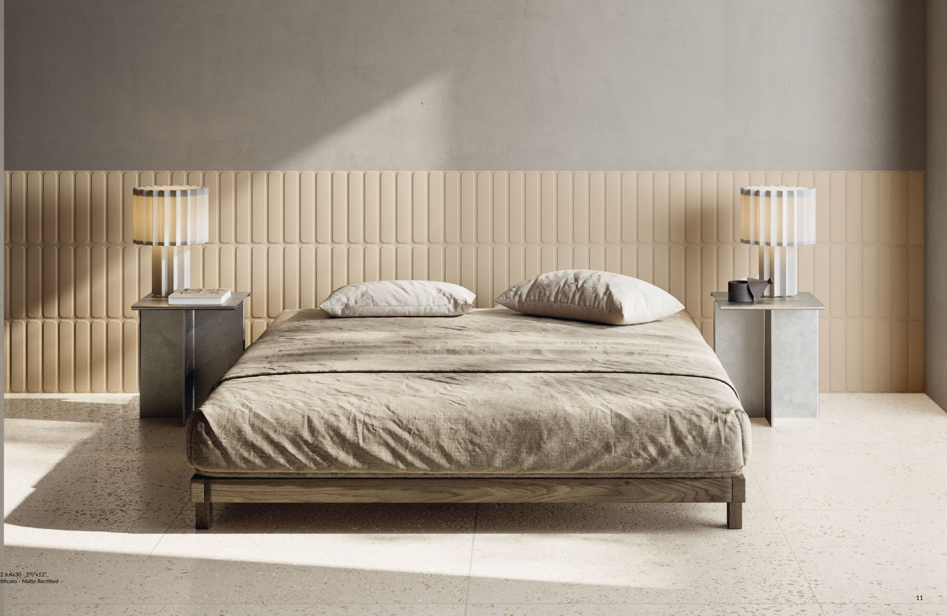
TRATTI Desert STR_2 6.4x30 - 2½"x12" Naturale Rettificato - Matte Rectified