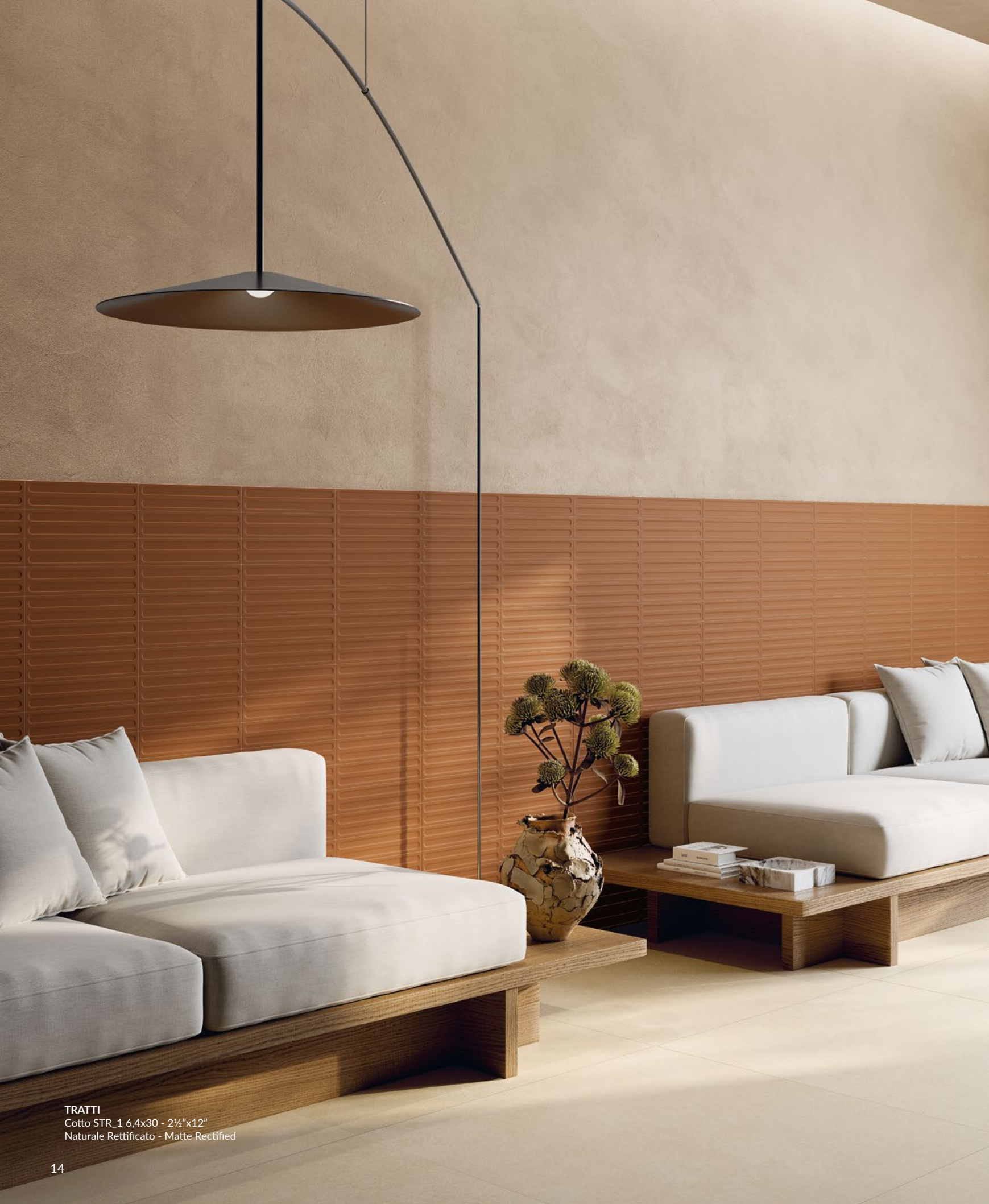
TRATTI Cotto STR_1 6,4x30 - 2½"x12" Naturale Rettificato - Matte Rectified