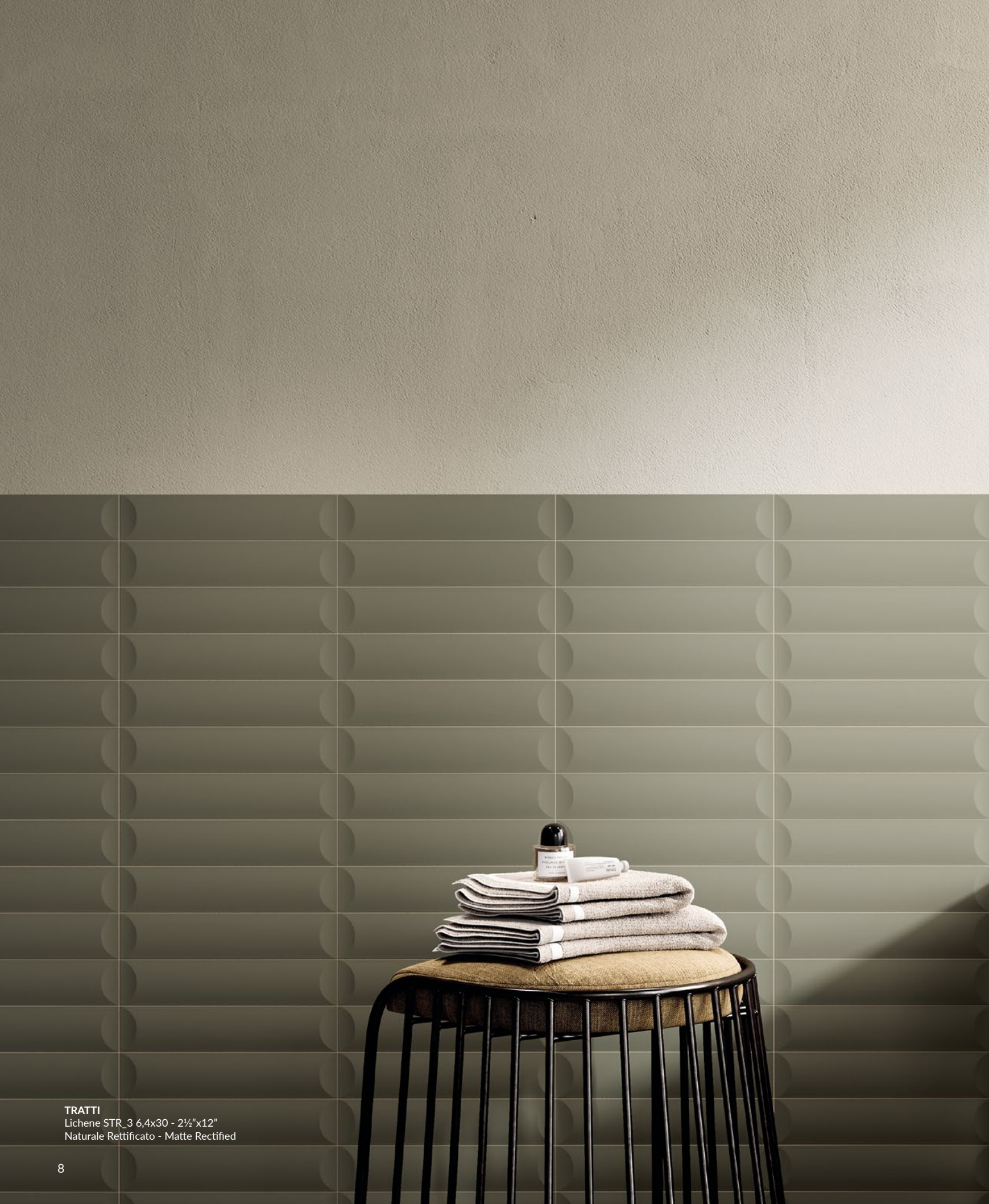
TRATTI Lichene STR_3 6,4x30 - 2½"x12" Naturale Rettificato - Matte Rectified