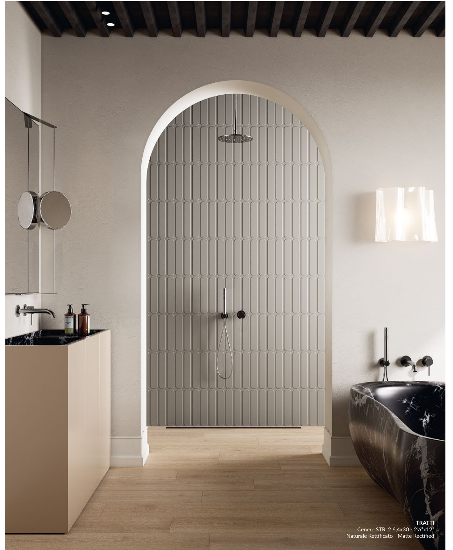
TRATTI Cenere STR_2 6,4x30 - 2 1/2"x12" Naturale Rettificato - Matte Rectified