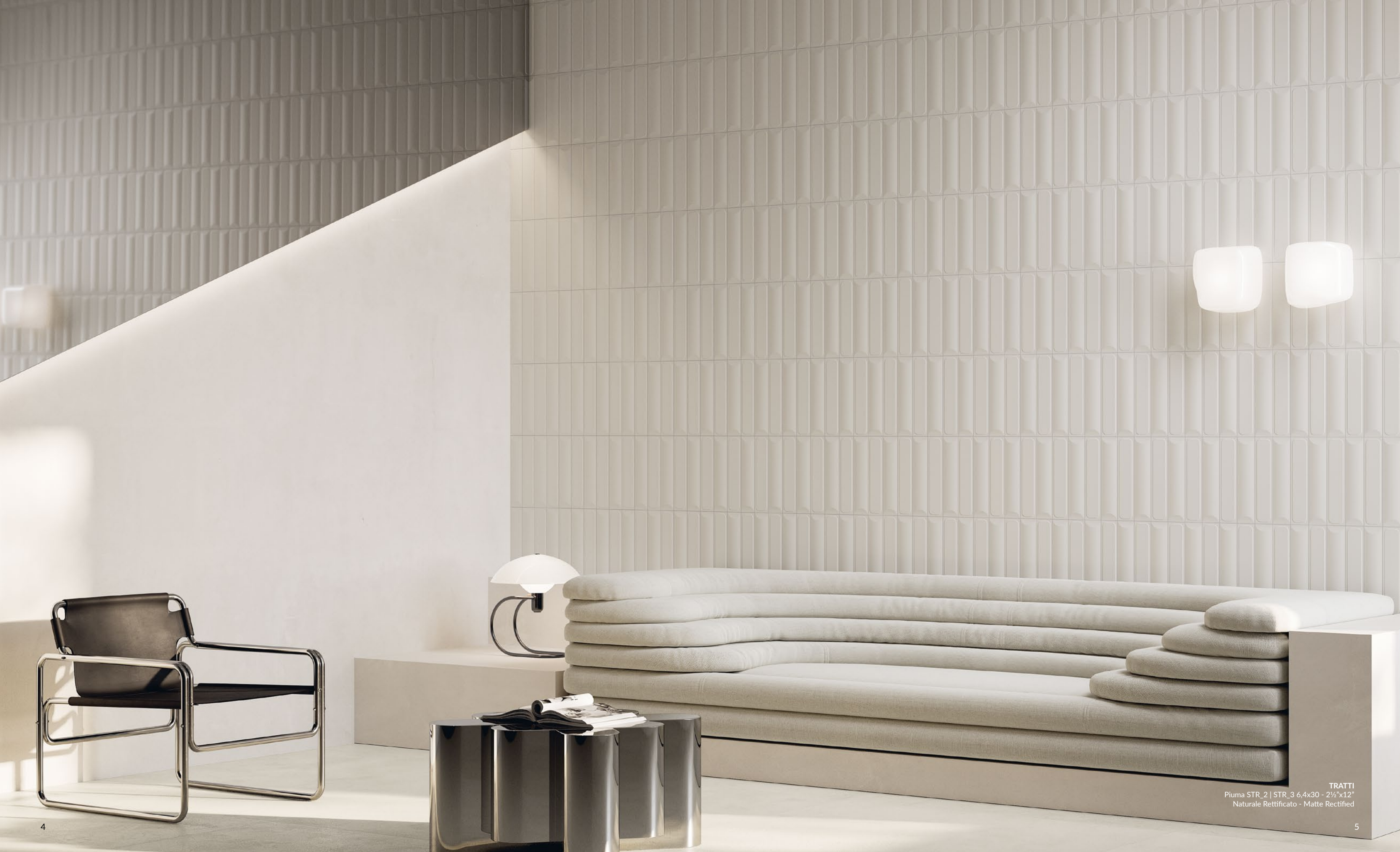
TRATTI Piuma STR_2 | STR_3 6,4x30 - 2½"x12" Naturale Rettificato - Matte Rectified